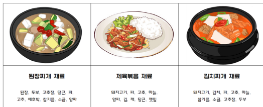
▲ 음식에 필요한 식재료 카드