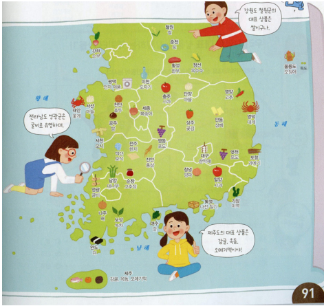
그림 4. 각 지역 대표 상품 조사를 위한 그림지도(비상교과서)

발점을 교과내용지식, 내용지식으로 거슬러 올라간다면, 이런 입지원리를 고려하지 못한 내용의 대부분은 경제적 교류의 이유를 경제적 이익에 둔 학습의 목표와 배치될 수도 있다.大本에서 역할놀이의 상황이나 배역의 설정은 사실적이지 않더라도, 배경지식은 사실과 원리에 근거한 실제적인(authentic)지식이어야 한다.